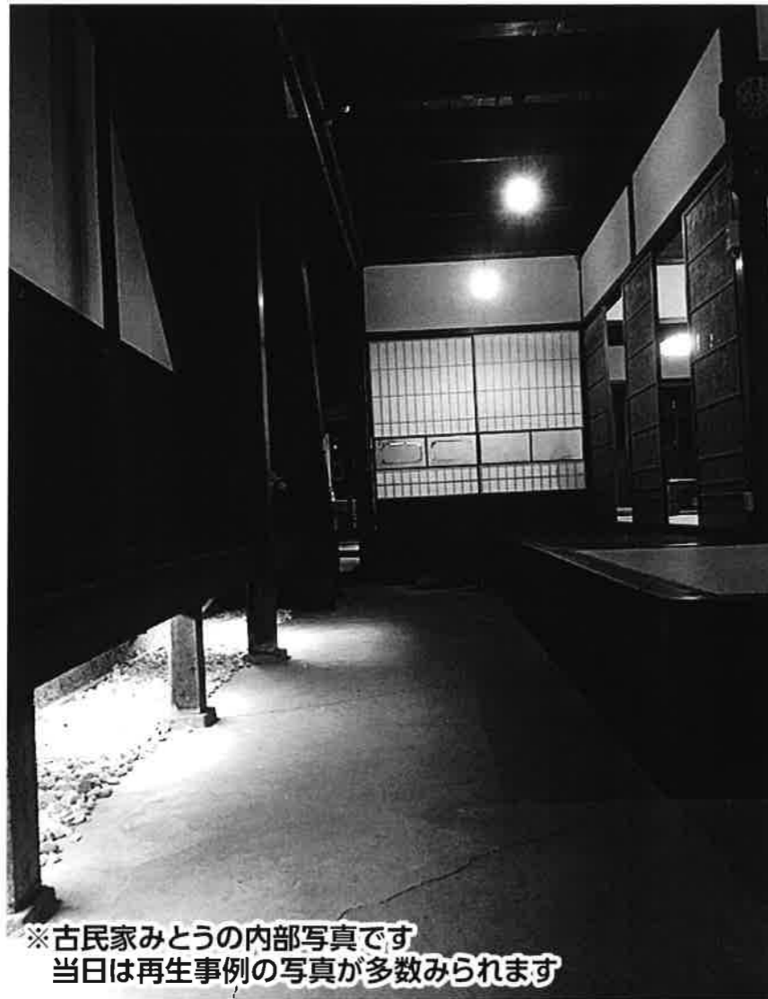
※古民家みとこの内部写真です 当日は再生事例の写真が多数みられます